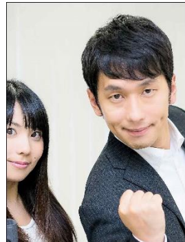
× Chụp cùng với người khác