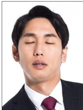
× Nhắm mắt