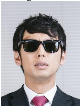
× Đeo kính râm