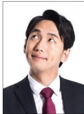
× Không nhìn thẳng