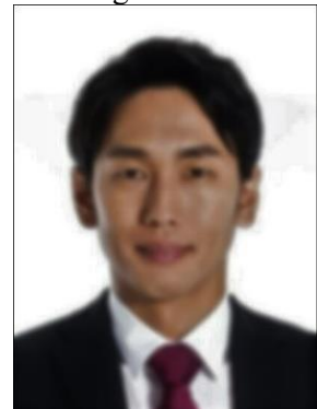
× Tối, không rõ