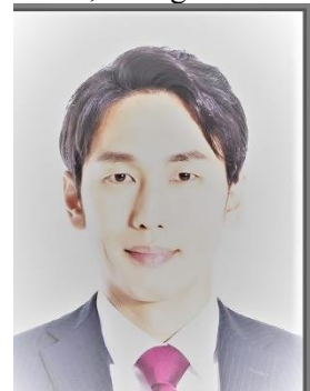
× Ảnh chụp lại từ ảnh