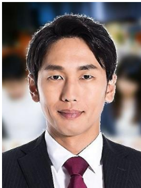
× Phông nền có màu