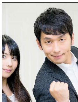
× 与其他人一起拍摄