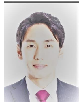
× 对着照片拍摄的照片