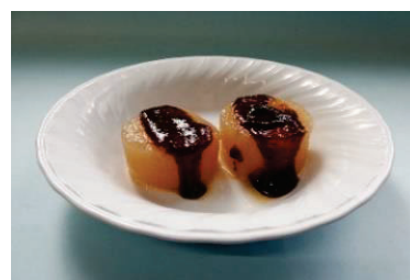
も つ しゃしん れい 盛り付け写真(例)

ちゅうしんおんどけいしやうじ きっきん しけんじかん つごうじやうしやうりやく ※中心温度計使用時の殺菌は、試験時間の都合上 省略しています。