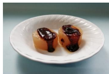
もりつけ しゃしん れい 盛り付け写真(例)

ちゅうしんおんどけいしやうじ さっきん しけんじかん つごうじやうしやうりやく ※中心温度計使用時の殺菌は、試験時間の都合上 省略しています。