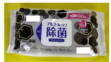
④除菌ウェットティッシュ (アルコールタイプ)