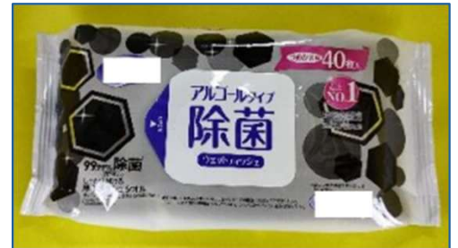
じよきん ⑥除菌ウェットティッシュ (アルコールタイプ)