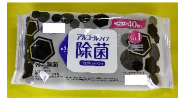
じよさん ④除菌ウェットティッシュ (アルコールタイプ)